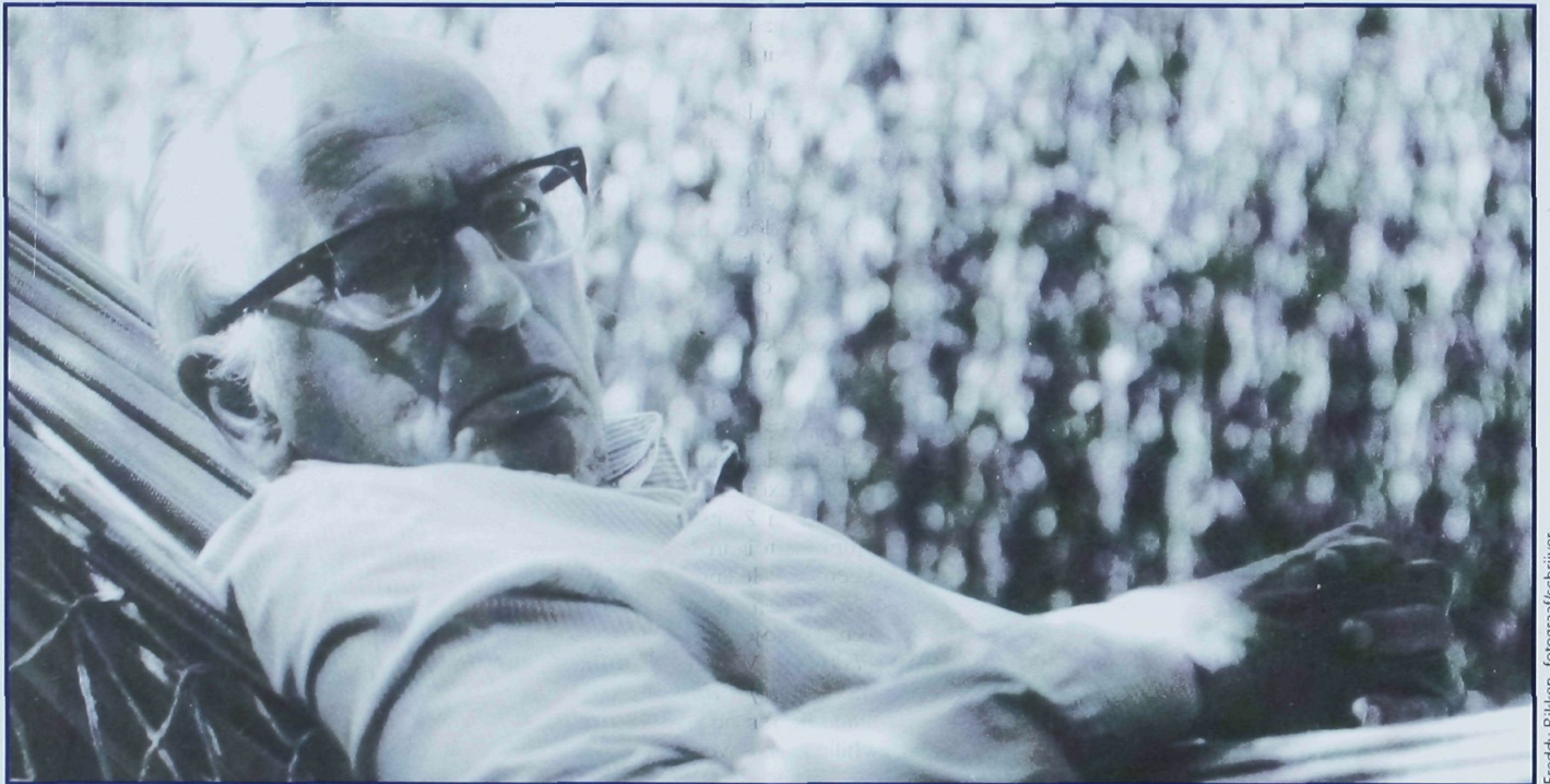
Freddy Rikken, fotograaf/schrijver

toen de stoet vlak voor ons langs naar de hoogleraarsbanken koerste overwoog ik dat zij met elkaar toch wel a sorry lot waren: zeer grote domheid las men op vele gezichten, onzegbaar leed en onuitwisbare schande op andere, op weer andere een combinatie van deze dingen. Vele ziektes ook en lichaamsgebreken waren, naar het leek, maar al te duidelijk. Bultenaars, scheefgegroeiden en kreupelen waren talrijker dan men in een verzameling volwassen mannen zou vermoeden, en het aantal zo op het oog kindse grijsaards bedroeg meer dan twintig procent. Zoals altijd kwam de kleine, zwarte dwerg als laatste binnen.