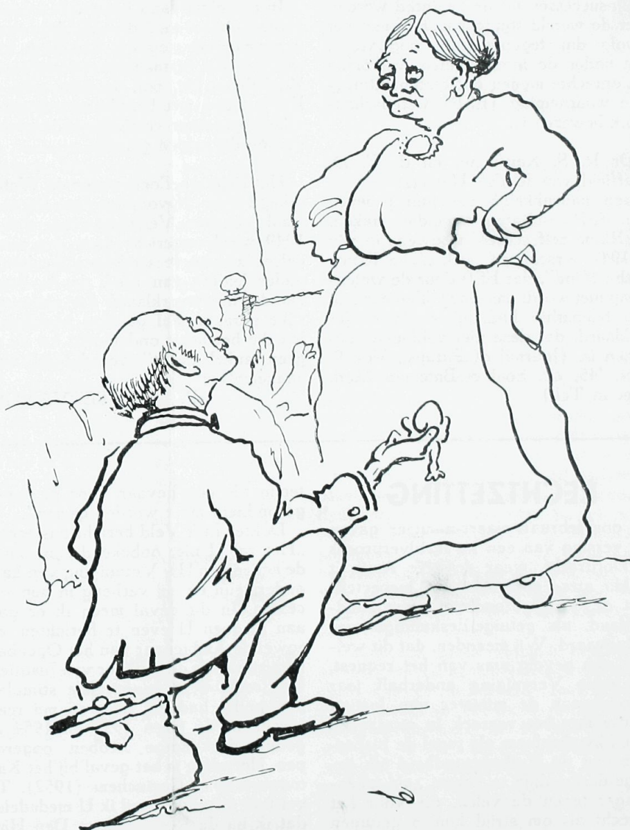
„Maar vrouw, je meent toch niet, dat ik ongeboren kinderen in mijn broekzak meedraag?”

zij houden de mensen terug van medisch onderzoek en doeltreffende behandeling. Daarom zijn ook de meest onbaatzuchtige onbevoegden, dat wil zeggen ondeskundige genezers, levensgevaarlijk. En daarom moeten zij allen zonder onderscheid geweerd worden. Niet omdat de Staat de dokters of het artseneroep moet beschermen, maar omdat elke zieke recht heeft op de bescherming, die slechts de wet kan verlenen.