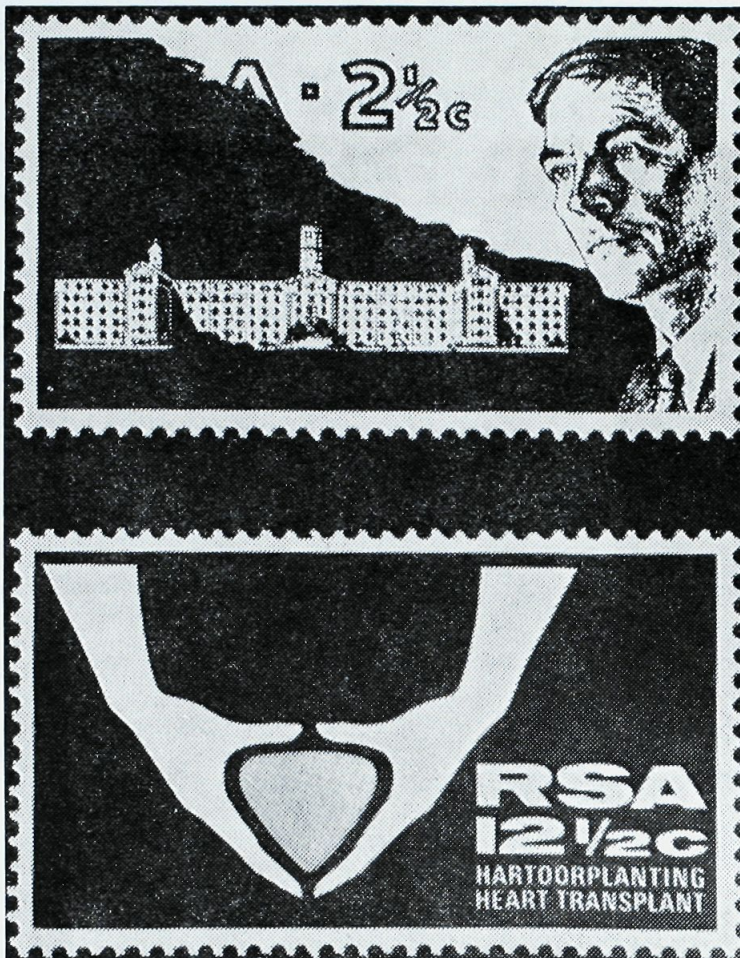
DE POSTZEGEL van de Zuidafrikaanse Republiek met een symbolische voorstelling van de harttransplantatie. Op de zegel van 2½ c. (boven) zijn het Groote Schuurziekenhuis en prof. Barnard afgebeeld.