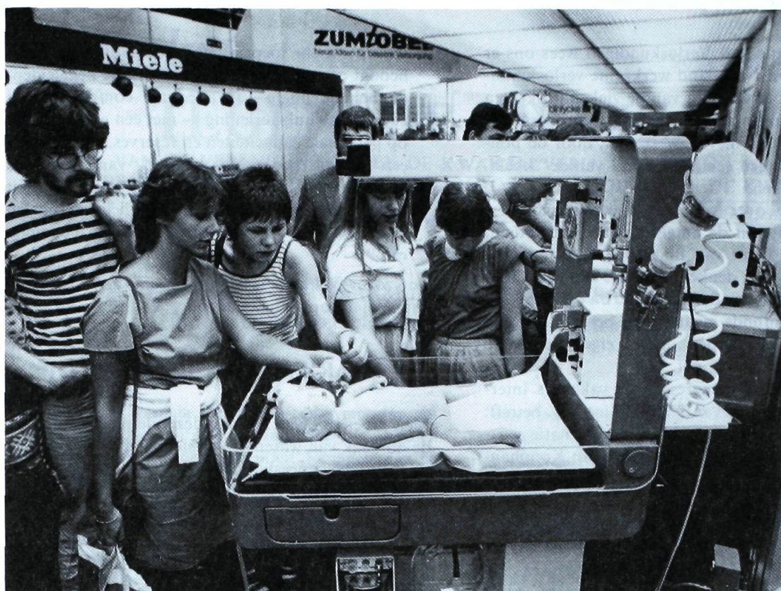
Jeugdige verpleegkundigen op de interhospital te Düsseldorf — de verloskunde en haar problemen