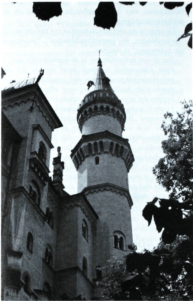
Neuschwanstein, de megalomanie van een eeuw geleden